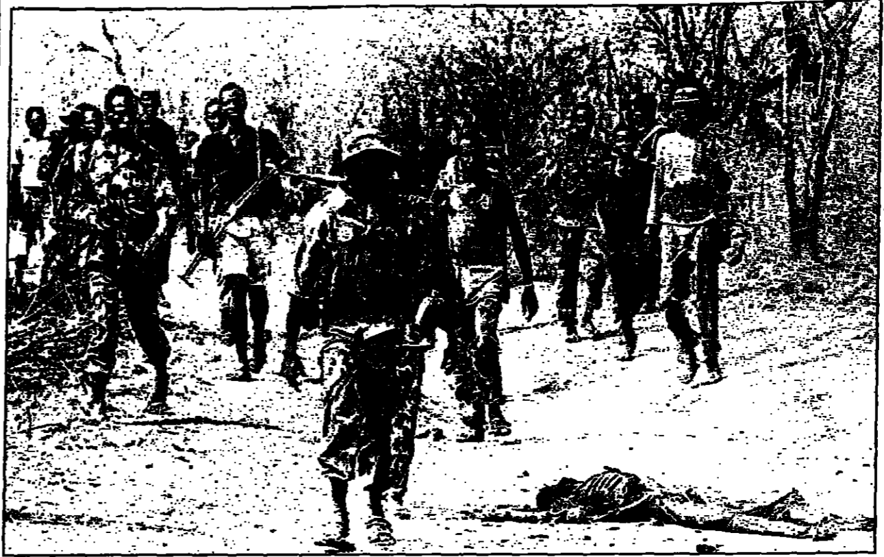
قوات تابعة لحركة جون فرنك